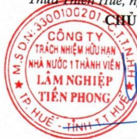
Tôn Thất Ái Tín